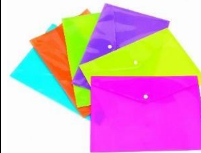
BUSTINA CON BOTTONE PER FOGLI FORMATO A4