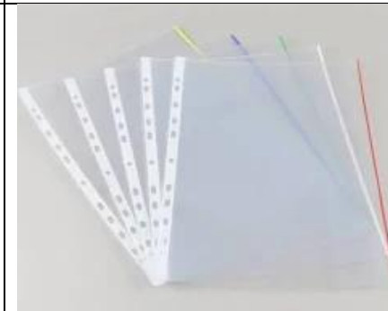
BUSTINE PER RACCOGLITORE

Le immagini sono puramente esemplificative, non si intende suggerire nessuna marca specifica.