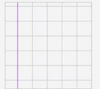
QUADRETTO DA 1 CM CON MARGINE