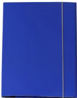
CARTELLINA RIGIDA CON ELASTICO