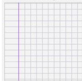
QUADRETTO DA 0,5 CM CON MARGINE