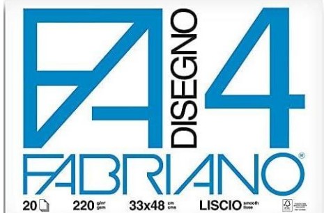
ALBUM CON FOGLI LISCI, NON RIQUADRATI