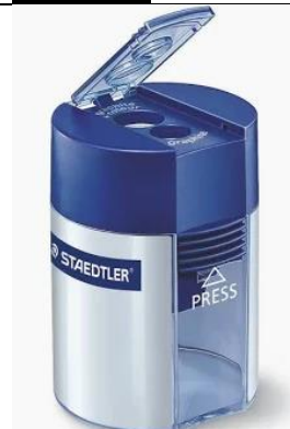
TEMPERINO CON SERBATOIO