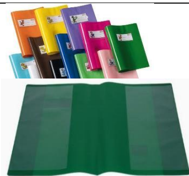
COPERTINA CON ALETTE