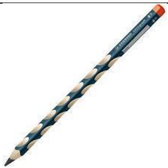
MATITA ERGONOMICA (TRIANGOLARE) HB O 2HB