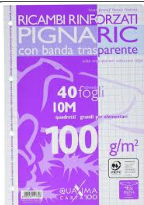
FOGLI PER RACCOGLITORE